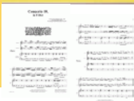
Concerto 10 - Deckblatt

Das vorliegende Konzert ist ein kürzeres dreisätziges Konzert für das Kirchentrio in F-Dur.