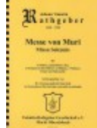
Messe von Muri - Deckblatt