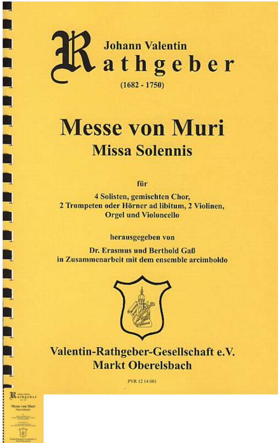
Messe von Muri - Deckblatt