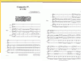
Concerto 17 - Deckblatt

Das vorliegende Konzert ist ein längeres dreisätziges Konzert für 2 Trompeten und das Kirchentrio in G-Dur.