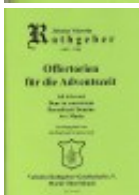
Opus 15 - Deckblatt