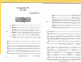
Concerto 17 - Deckblatt

Das vorliegende Konzert ist ein längeres dreisätziges Konzert für 2 Trompeten und das Kirchentrio in G-Dur.