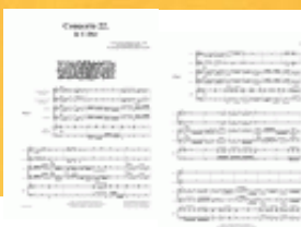
Concerto 22 - Deckblatt

Das vorliegende Konzert ist ein kürzeres dreisätziges Konzert für 2 Trompeten und das Kirchentrio in C-Dur.